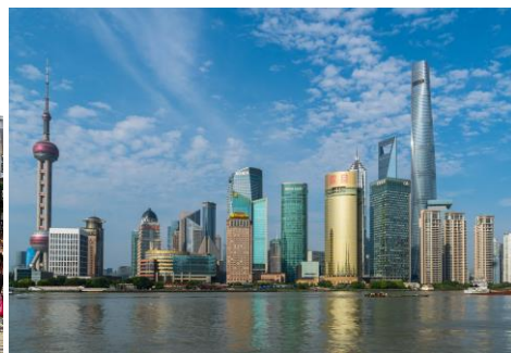
Abb. 3: Skyline / Shanghai