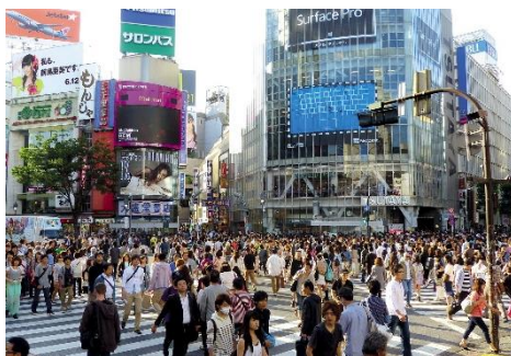
Abb. 2: Shibuya / Tokio