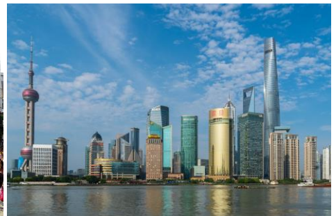
Abb. 3: Skyline / Shanghai