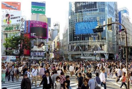
Abb. 2: Shibuya / Tokio