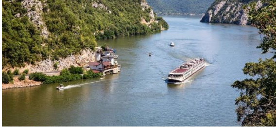
Preis- u. Tarifstand